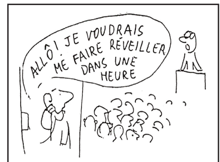
Photographie et extraits de Dessins humoristiques et satiriques 1. Sławomir Mroźek

Métro : Pont Marie (7), St-Paul (1) RER : St-Michel - Notre-Dame (B, C) Bus : 67, 86, 87