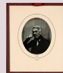
Louis-Auguste Bisson, Jules Michelet, 1847

Kolekcja fotograficzna została utworzona w latach 30. XX wieku. Składa się na nią zespół fotografii historycznych i artystycznych polskich i francuskich autorów. Szczególnie wartościowy jest zbiór 20 dagerotypów (L.A. Bisson, J.F. Zieliński, Godet), negatywów szklanych , a także odbitek autorstwa wybitnych artystów XIX i XX w. (Nadar, Jan Bułhak, Pierre Choumoff...).