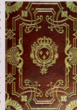
Oprawa opatrzona supereklibrysem rodziny Burbonów, 1750.

W zbiorach książkowych BPP znajduje się kilkaset ekslibrysów i supereklibrysów (od XVI do XX w.) . Wiele z nich to znaki własnościowe francuskich i polskich rodzin arystokratycznych. Są wśród nich arcydzieła sztuki intro-ligatorskiej Europy Zachodniej, głównie francuskiej.