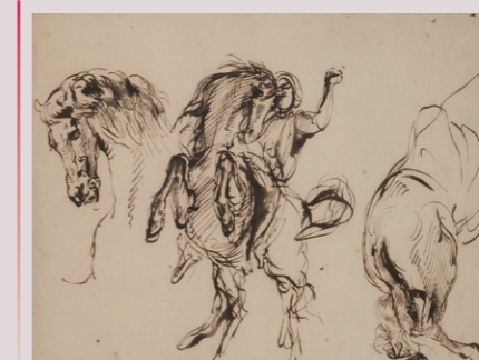
Konie i jeździec, szkic, Eugène Delacroix.

Publiczność może korzystać z czytelni i pracowni zbiorów specjalnych, których godziny otwarcia widnieją na naszej witrynie internetowej.