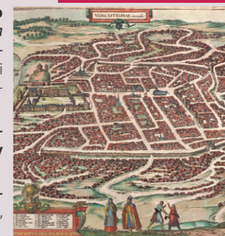
Panorama Wilna, Georg Braun, Frans Hogenberg, 1583.

THL/BPP chroni unikatowe skarby kultury polskiej i wpisuje je tym samym w spuściznę intelektualną i kulturalną Europy, a jej dziedzictwo dokumentacyjne zostało wpisane w 2013 r. na listę programu UNESCO „Pamięć Świata”.